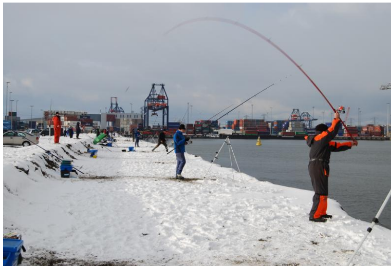
Junioren in actie